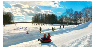
羊ヶ丘スノーパーク