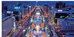
さっぽろテレビ塔展望台