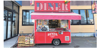
キッチンカーも登場!