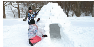
イグルー作り体験(有料)